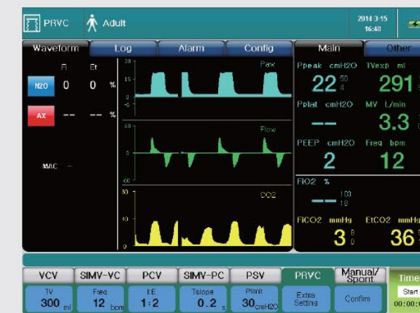
Modo avançado de ventilação