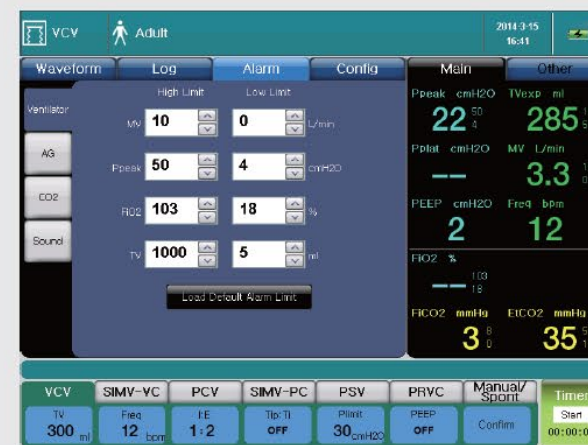
Interface de ajuste de alarmes